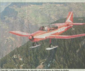
"Type 100", l'un des rétro-aéronefs de l'air-club, en vol au-dessus de l'air-club de Méribel.