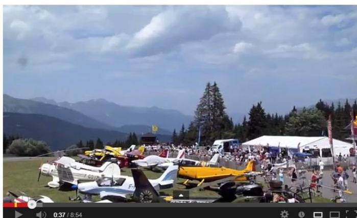
Meribel Air Show 2013 day 1 - Sunday 28 july