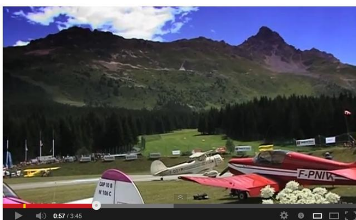
Meribel Airshow 2013 Highlights

http://www.youtube.com/watch?v=wJv94Mmc_M